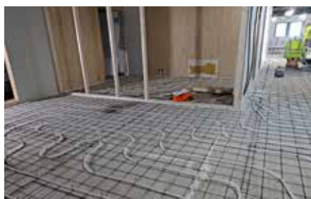
Toimistoon asennettiin lattialämmitys.

mistomme värimaailmaa – sinistä, valkoista, harmaan sävyjä, tammea, piristykseenä pikkuisen terrakottaa.