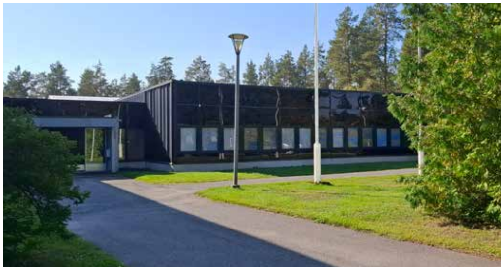
Uuden toimiston ulkokuva.

Already some time ago, when we acquired the whole production facility and the area