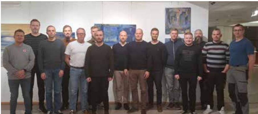
ISO GPS-toleranssikoulutus 24-25.10.2024 kulttuurikeskus Crusellissa.

Syksyllä halusimme kerätä niin omia työntekijöitä kuin asiakkaiden henkilöitä kasaan ISO GPS-toleranssikoulutukseen. Tarve koulutukselle ilmeni työhohella ajan kanssa, mikä näkyi kiitoksena osallistujilta koulutuksessa.