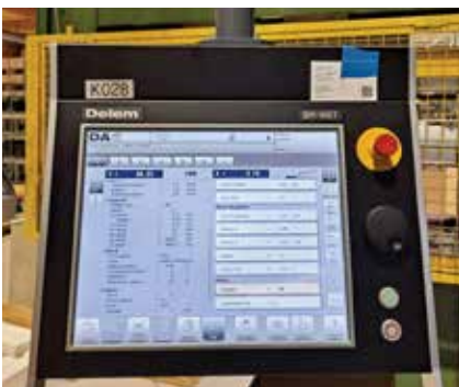
Hybridisärmäyspuristimessa on Delemin 3D-kosketusnäyttöohjaus.

Älykkäisiin konepajateknologioihin ja elinkaari palveluihin erikoistunut Vossi Group Oy on maahantuonut Turkin vanhimman